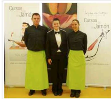
Finalistas del Concurso de cortadores de jamón

Los concursantes demostraron su destreza con el cuchillo jamonero y pusieron en práctica las enseñanzas de las Escuelas de Hostelería. Cada alumno realizó el corte de una ración que debía aproximarse a un peso de 80gr y con un límite de tiempo de 5 minutos. Además se tuvo en cuenta el estilo a la hora de cortar, el grosor y tamaño de las lonchas, la limpieza de la zona de corte y la presentación en plato.