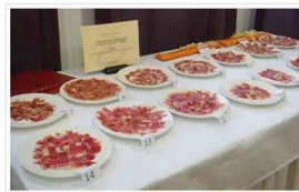
Raciones de jamón cortadas por los participantes

Hay que destacar el altísimo nivel de preparación de todos y cada uno de los concursantes, si bien, los nervios de la puesta en escena de lo aprendido en las aulas, jugaron más de una mala pasada.